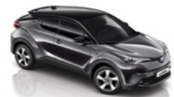
Сірий "металік" з чорним дахом 2NB 3