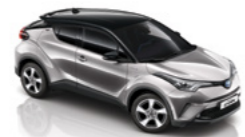
Сірий "металік" з чорним дахом 2NK 3