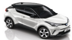
Білий "перламутр" з чорним дахом 2NA 3