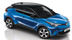
Синій "металік" з чорним дахом 2NH 3